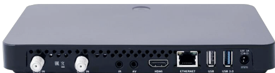
Рис. 1. Приставки с типом блока 12В, 3А